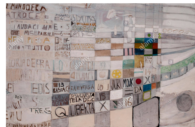
Gastone Novelli, Poetry reading tour , 1961